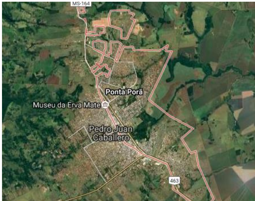
Figura 1: Distribuição urbana dos municípios de Ponta Porã-MS, Brasil e Pedro Juan Caballero-Amambay, Paraguai.